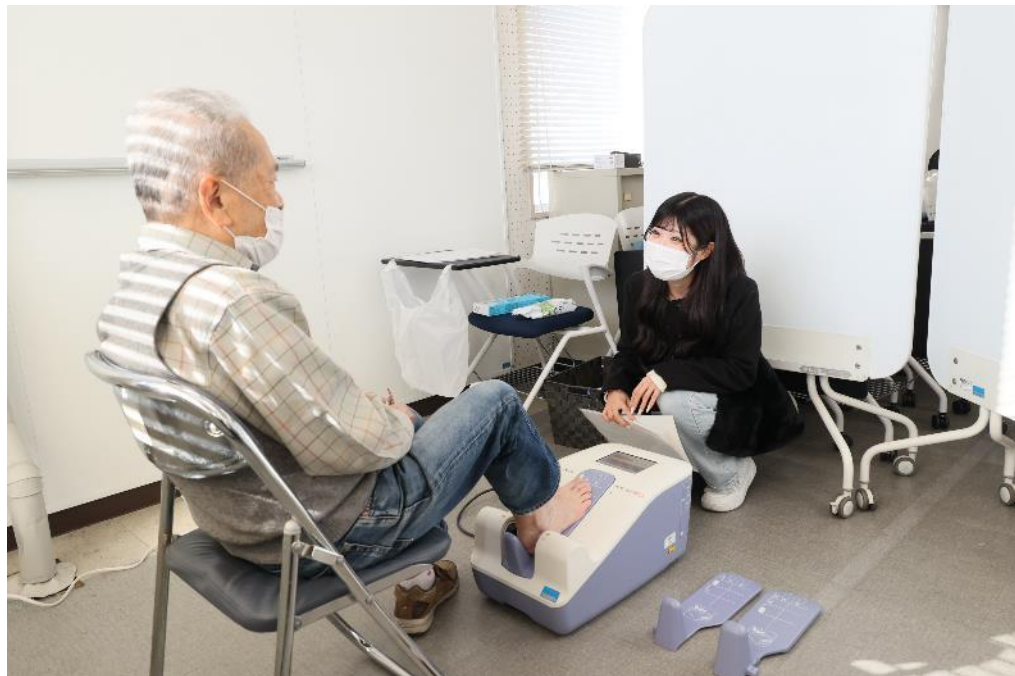
骨密度測定の様子